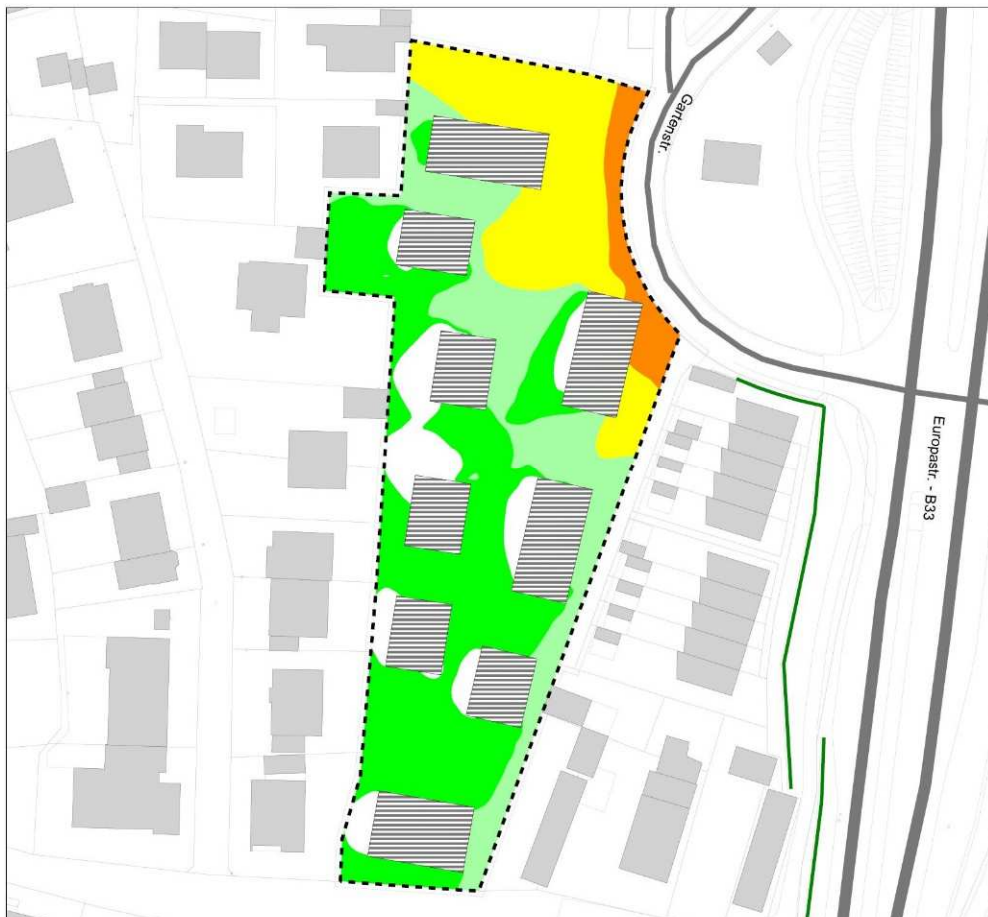
Schallimmissionen durch Straßenverkehr