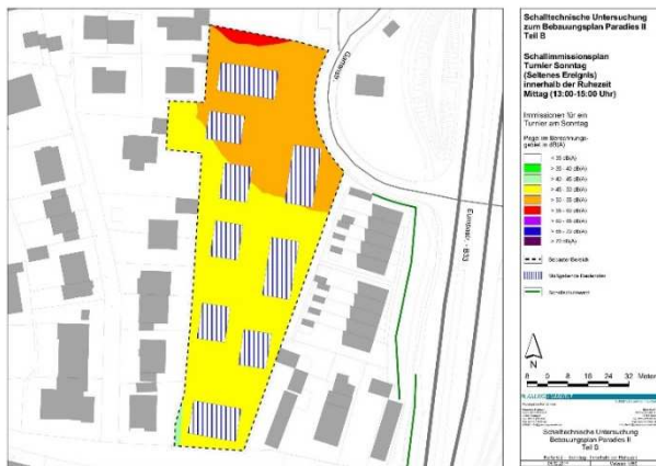
Schallimmissionen der Sportanlagen